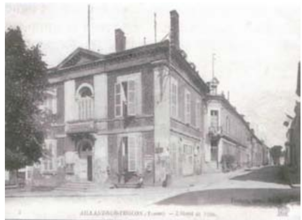
Ancienne façade de la Mairie