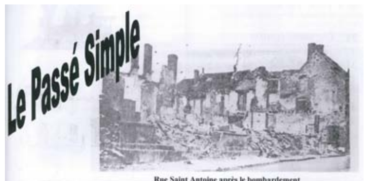
Rue Saint Antoine après le bombardement